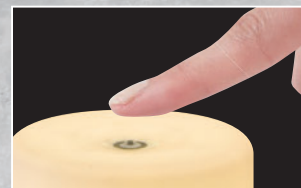
タッチセンサー式