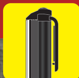
ペンクリップ (180°回転)