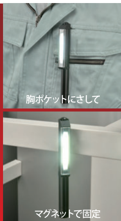
胸ポケットにさして