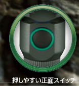
押しやすい正面スイッチ