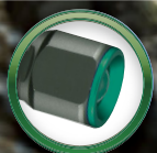
四角いので転がらない