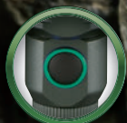
押しやすい正面スイッチ