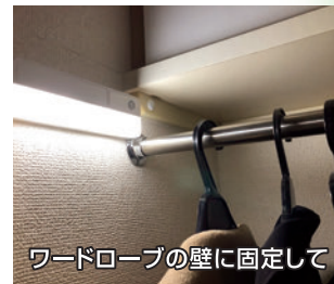
※写真は点灯イメージです。