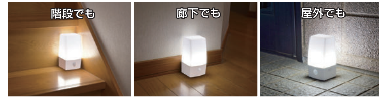
※写真は点灯イメージです。