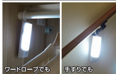
ワードローブでも