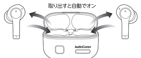
ケースに戻すと自動でオフ(充電開始)